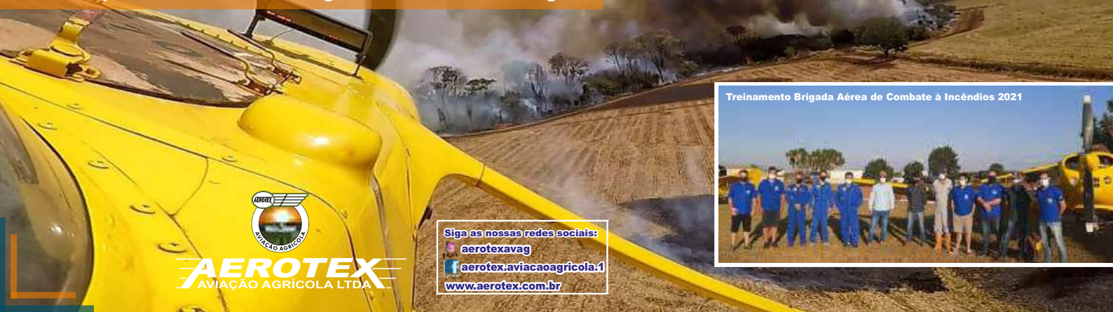
Treinamento Brigada Aérea de Combate à Incêndios 2021

Uma equipe bem treinada minimiza os prejuízos durante os focos. Prevendo o período de seca que se inicia em julho estamos trabalhando arduamente para oferecermos aos nossos clientes o que há de melhor em brigada aérea em nossa região.